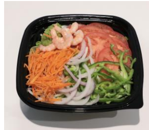
野菜全カDAYのサラダ

レタスの量はレギュラーサイズのサンドイッチの約7倍! 他の4種類の野菜は約2倍の量が入る、ボリュームたっぷりのサラダ。販売価格はレギュラーサンドイッチ価格に+300円と、野菜たっぷりなのにとってもお得。全てのサンドイッチメニューを「サラダ」でお楽しみいただけます。