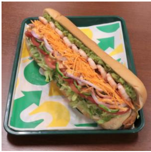
野菜全カDAYのフットロング

「フットロング」はレギュラーの2倍のサイズで約30cmあります。レギュラー価格に+300円とお手ごろ価格で、2倍にボリュームアップできる、とってもお得なメニューです。