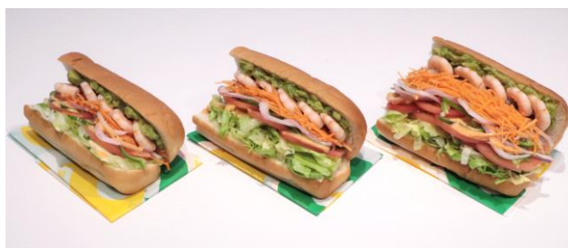
普通の野菜量(左)、普通の野菜多め(中)、野菜全力DAYの野菜多め(右)

“梅雨バテ”に負けないように、 シャキシャキ・みずみずしい野菜をたっぷり食べてリフレッシュ。